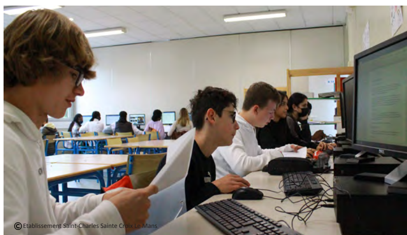
© Etablissement Saint-Charles Sainte-Croix Le Mans